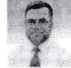
মহম্মদ হাসান মিডিয়া