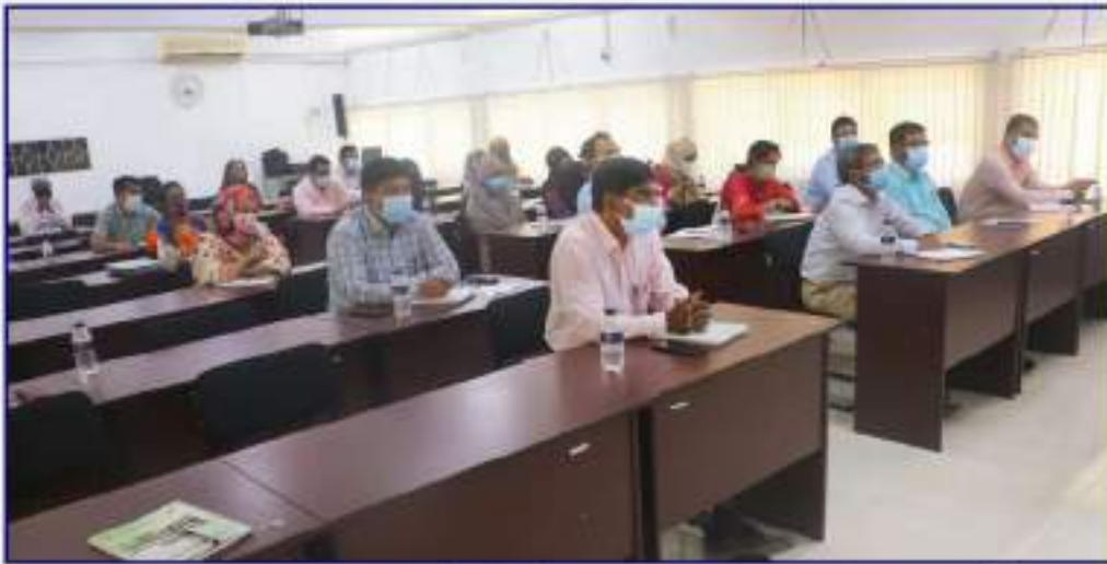
“এ” (৯ম হতে ৩য় গ্রেড) ক্যাটাগরির ইন-হাউজ প্রশিক্ষণে নাটার ফ্যাকাল্টিবৃন্দ