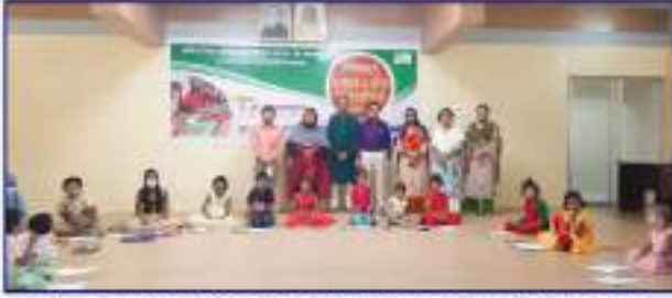
মুজিব জন্মশতবার্ষিক ও স্বাধীনতার সুবর্ণ জয়ন্তী উপলক্ষে শিশু-কিশোরদের জন্য চিত্রাঙ্কন প্রতিযোগিতার আয়োজন