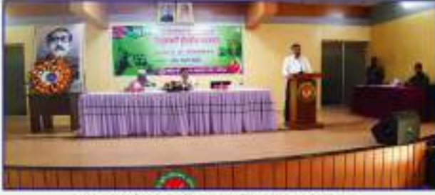
৭ মার্চ ঐতিহাসিক জাতীয় দিবস পালন