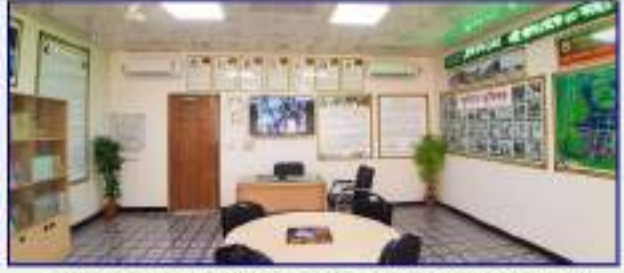
নাট্য বঙ্গবন্ধু ও মুক্তিযুদ্ধ কর্ণার (মন ও মননে বঙ্গবন্ধু)