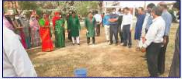
মুজিব জন্মশতবার্ষিক ও স্বাধীনতার সুবর্ণ জয়ন্তী উপলক্ষে কর্মকর্তা কর্মচারীদের সমন্বয়ে হাঁড়িভাঙ্গা, সুইসুতা সৌঁড়, কল নিক্ষেপ সহ মজাদার সব রকম খেলাধুলার আয়োজন

মুজিব জন্ম শতবার্ষিকী উপলক্ষে নাট্য কর্তৃক গৃহীত পদক্ষেপের অংশ বিশেষ