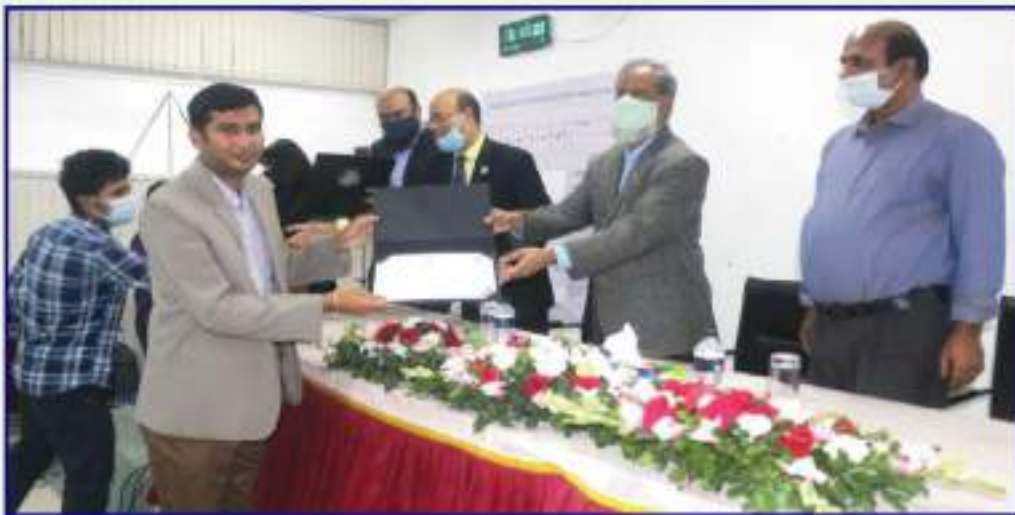
“আবহাওয়ার পূর্বাভাস সংক্রান্ত” প্রশিক্ষণ কোর্সে অংশগ্রহণকারী প্রশিক্ষণার্থীগণ সনদ গ্রহণ করছেন