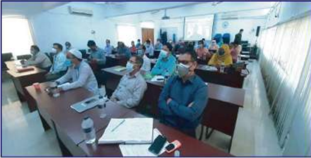
টেকসই উন্নয়ন অভীষ্ট (এসডিজি) বিষয়ক প্রশিক্ষণ কাম কর্মশালায় অংশগ্রহণকারী প্রশিক্ষণার্থীগণ