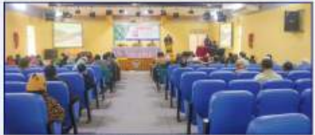
“করোনাকালে কৃষি উৎপাদন ব্যবস্থাপনা ও আমাদের করণীয়” শীর্ষক সেমিনারে আমন্ত্রিত অতিথিবৃন্দ