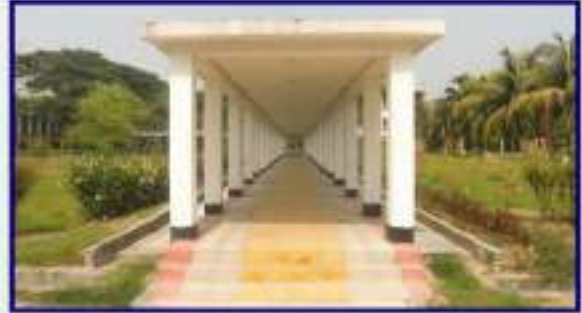
জাতীয় কৃষি প্রশিক্ষণ একাডেমি শক্তিশালীকরণ প্রকল্পের আওতায় করিডোর নির্মাণ