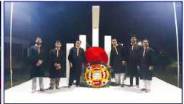
আন্তর্জাতিক মাতৃভাষা দিবস পালন