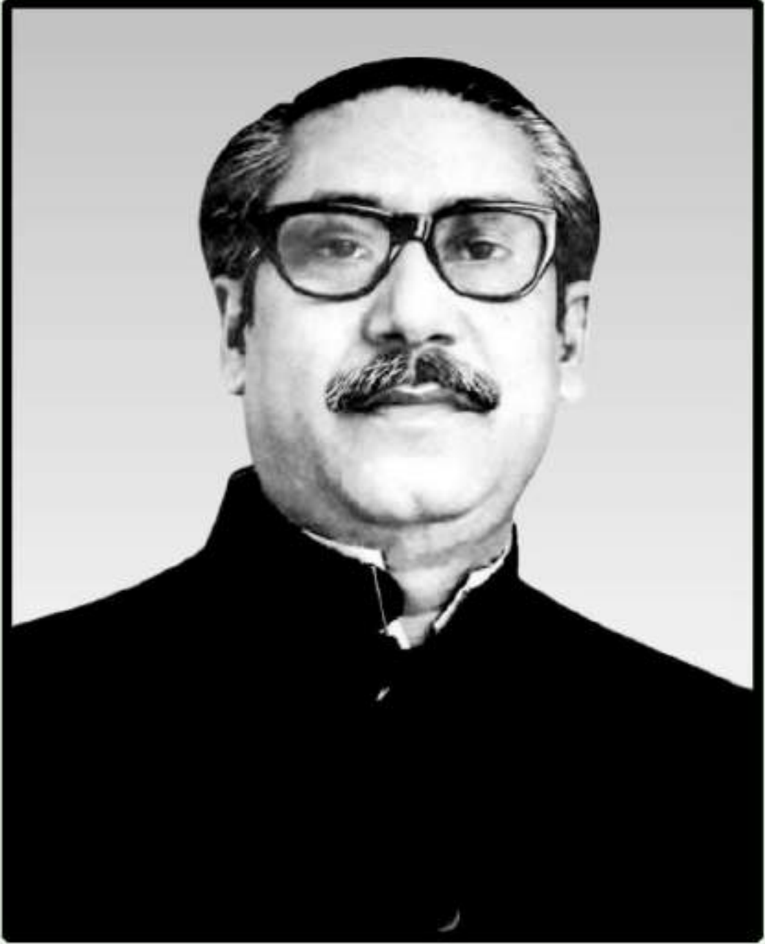
জাতির পিতা বঙ্গবন্ধু শেখ মুজিবুর রহমান