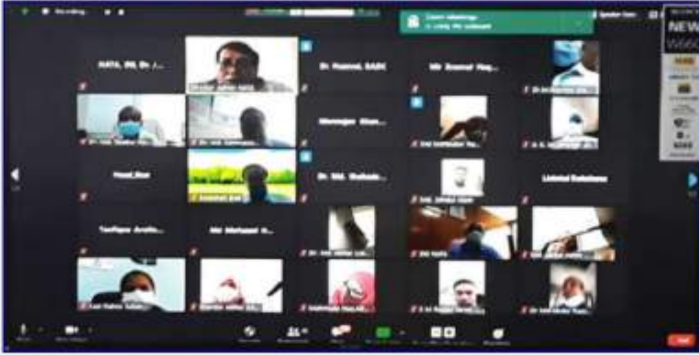
নাট্যের একাডেমিক কার্যক্রম শীর্ষক ভার্চুয়াল সভায় অংশগ্রহণকারীদের একাংশ