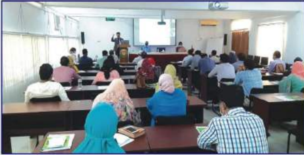
বার্ষিক কর্মসম্পাদন চুক্তি বিষয়ক প্রশিক্ষণ কাম কর্মশালায় অংশগ্রহণকারী প্রশিক্ষণার্থীগণ