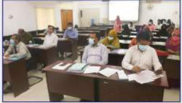
নাটায় ভ্যালিডেশন ওয়ার্কশপে জুম প্র্যাটিকর্মে বক্তব্য রাখছেন অতিরিক্ত সচিব (প্রশাসন) মহোদয়