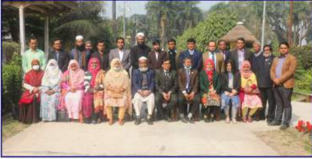
এটিআই কর্মকর্তাদের দক্ষতা উন্নয়ন (স্পর্ড) প্রশিক্ষণ-এ অংশগ্রহণকারী প্রশিক্ষণার্থীগণ