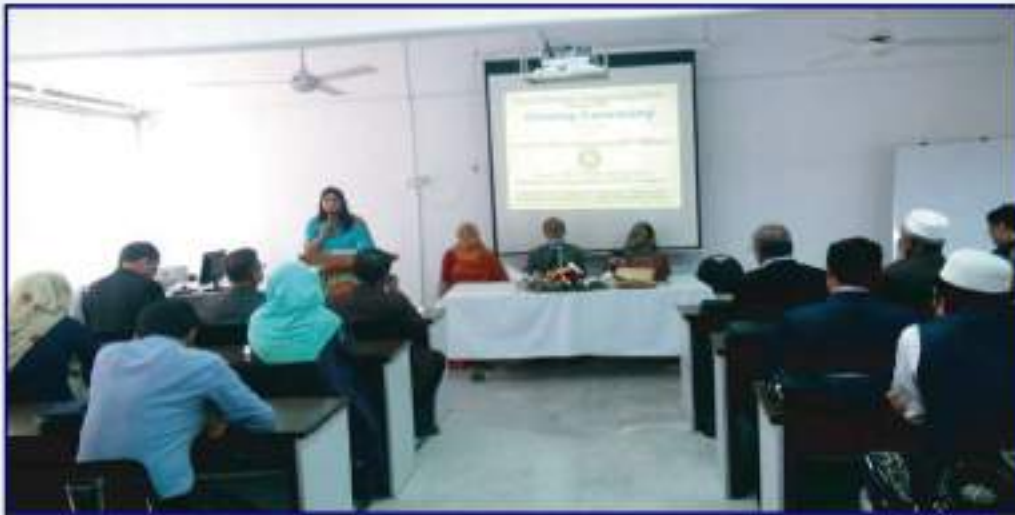
এটিআই কর্মকর্তাদের দক্ষতা উন্নয়ন (স্পর্শত) প্রশিক্ষণ এ অংশগ্রহণকারী প্রশিক্ষণার্থীগণ