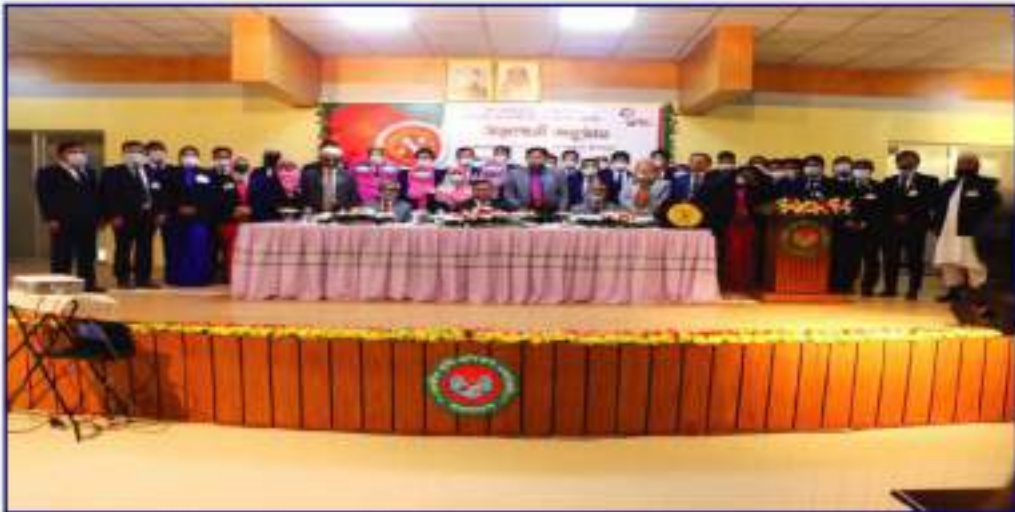
ন্যাশনাল এগ্রিকালচারাল রিসার্চ সিস্টেম ভুক্ত প্রতিষ্ঠানের বিজ্ঞানীদের ২৭তম বুনিয়াদি প্রশিক্ষণ কোর্সের উদ্বোধনী অনুষ্ঠানে সিনিয়র সচিব মহোদয়ের সাথে প্রশিক্ষণার্থীবৃন্দ