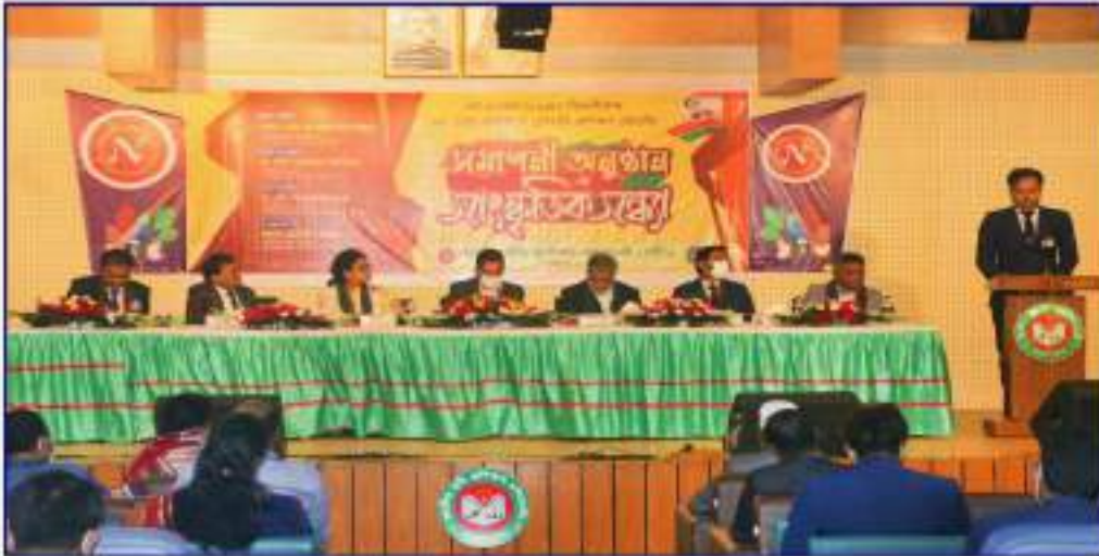
ন্যাশনাল এগ্রিকালচারাল রিসার্চ সিস্টেম (এনএআরএস) ভুক্ত প্রতিষ্ঠানের বিজ্ঞানীদের ২৭ তম বুনিয়াদি প্রশিক্ষণ কোর্সের সমাপনী অনুষ্ঠান