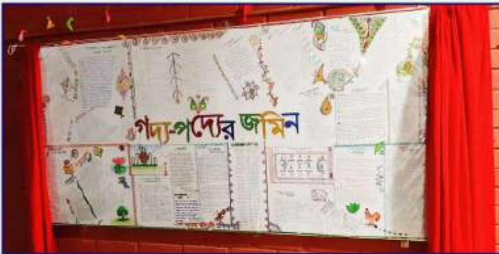
'গদ্য-পদ্যের জমিন' শিরোনামে নান্দনিক দেয়ালিকা