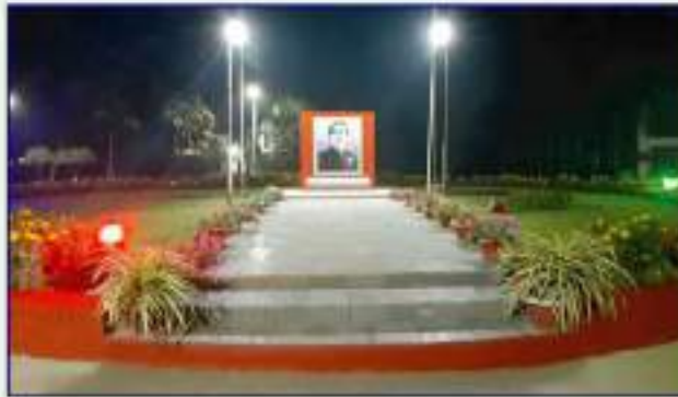
মুজিব জন্মশতবার্ষিকী উপলক্ষ্যে নাট্যের 'বঙ্গবন্ধুর অস্থায়ী প্রতিকৃতি' স্থাপন

শহীদ মিনার স্থাপন ও শহীদ দিবস পালন: নাট্যের নজিরবিহীন দ্রুততার সাথে শহীদ মিনার স্থাপন করা হয়। একুশ এর প্রথম প্রহরে নবনির্মিত এই শহীদ মিনারে প্রথম বারের মত পুষ্পার্ঘ্য অর্পণ করা হয়।