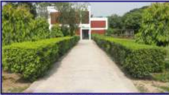
জাতীয় কৃষি প্রশিক্ষণ একাডেমি শক্তিশালীকরণ প্রকল্পের আওতায় আর.সি.সি (লিংক রোড টু বিল্ডিং) নির্মাণ

(অক্টোবর/২০১৫-জুন/২০২১) ক্রমপুঞ্জিত ব্যয় ৪৯৭৩.৭২লক্ষ টাকা। ২০২০-২১ অর্থবছরে যে কাজগুলি সমাপ্ত হয়েছে সেগুলি হলো- আবাসিক ভবন মেরামত, লেবার শেড, বাউন্ডারি ওয়াল (অফিস), বাউন্ডারি ওয়াল (আবাসিক) মেরামত, ডিজি বাংলা, আর.সি.সি (লিংক রোড টু বিল্ডিং), (ফার্ম রোড টু বাউন্ডারি ওয়াল), ডরমিটরি (৫ম ও ৬ষ্ঠ তলা), মেডিকেল সেন্টার কাম ডে কেয়ার সেন্টার, কাম গেস্ট হাউজ কাম অফিসার্স ডরমিটরি (৩য় ও ৪র্থ তলা), আর.সি.সি রোড (অফিস ইন্টারনাল রোড ড্রেনসহ), আর.সি.সি সারফেস ড্রেন (৪ ফুট স্লাব সহ) নির্মাণ এবং অভিটরিয়াম আপগ্রেডেশন, ক্যাফেটেরিয়া এক্সটেনশন ও এক্সটারনাল ইলেকট্রিফিকেশন।