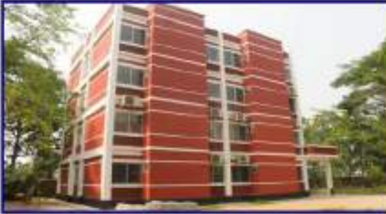
জাতীয় কৃষি প্রশিক্ষণ একাডেমি শক্তিশালীকরণ প্রকল্পের আওতায় মেডিকেল সেন্টার কাম ডে কেয়ার সেন্টার কাম গেস্ট হাউজ কাম অফিসার্স ডরমিটরি (৩য় ও ৪র্থ তলা) নির্মাণ