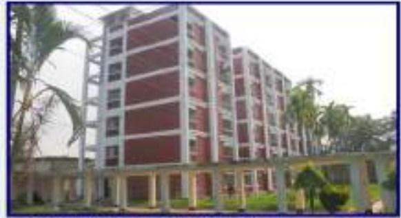
জাতীয় কৃষি প্রশিক্ষণ একাডেমি শক্তিশালীকরণ প্রকল্পের আওতায় ডরমিটরি নির্মাণ