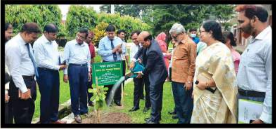
অনুষ্ঠানে সচিব স্যার নাটা চত্বরে ১টি বৃক্ষ রোপন করছেন।

উদাহরণস্বরূপ সচিব স্যার বলেন, “সরকার কৃষিক্ষেত্রে প্রচুর ভর্তুকী দেন। ২৮ লাখ টাকার হারভেস্টার কৃষক পাচ্ছে ৭ লাখ টাকায়। ১০০ টাকার সার কৃষক পায় ১৫ টাকা কেজি দরে। মানুষের খাদ্যাভ্যাসেও ব্যাপক পরিবর্তন এসেছে। আগে ফলের দোকান ছিলো গুব্বের দোকানের পাশে। অর্থাৎ মানুষ অসুস্থ হয়ে হাসপাতালে গেলে তবেই তার জন্য সাধারণত আত্মীয় স্বজনরা ফল কিনে হাসপাতালে দেখতে যেতেন। কিন্তু বর্তমানে এ চিত্র ভিন্ন। এখন যত্র তত্র ফলের দোকান দেখতে পাওয়া যায়। ঠিক তেমনি আগে সপ্তাহে ১দিন হাটবার ছিল, সেদিনই ভালো ভালো মাছ, মাংস পাওয়া যেতো। এখন সকাল বিকাল সবসময়ই (২৪/৭) মাছ, মাংস কিনতে পারেন এ দেশের জনগণ।” এসবের মাধ্যমে আমাদের অর্থনৈতিক এবং সামাজিক সূচকে সমৃদ্ধির প্রমাণ মেলে।