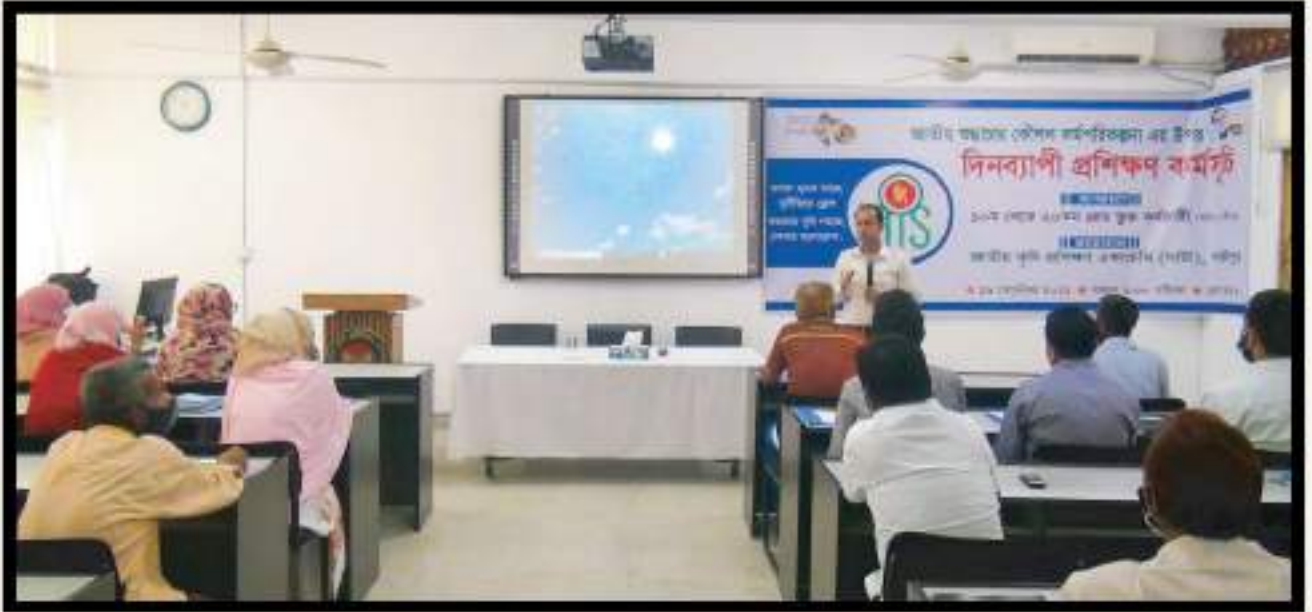
নাটায় দিনব্যাপী এনআইএস (NIS) সংক্রান্ত প্রশিক্ষণে প্রশিক্ষণার্থীবৃন্দ