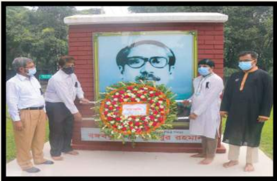
১৫ আগস্ট ২০২১ এ নাটা চত্বরে অবস্থিত বঙ্গবন্ধুর ম্যুরালে পুষ্পস্তবক অর্পণ করছেন নাটার তৎকালীন মহাপরিচালক, পরিচালক (প্রশিক্ষণ), পরিচালক (প্রশাসন ও সাপোর্ট সার্ভিস)