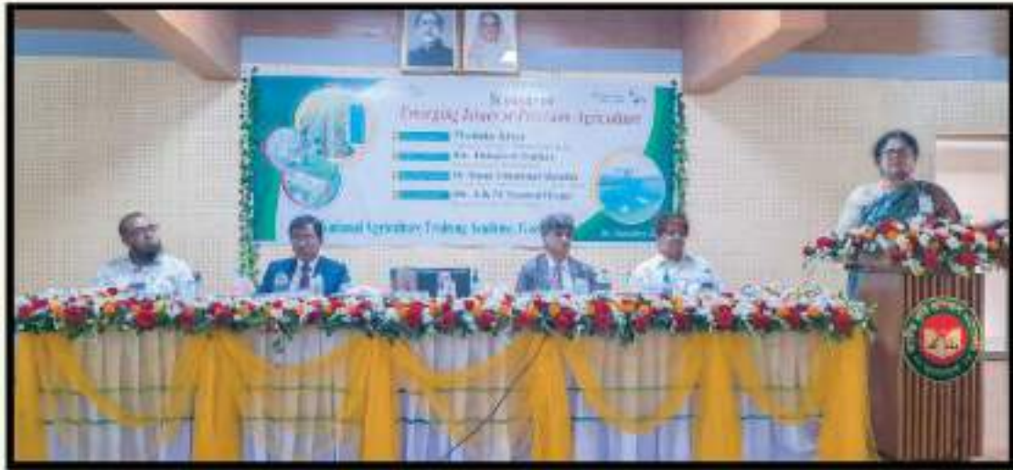
“Emerging Issues in Precision Agriculture” শীর্ষক সেমিনারে বক্তব্য রাখছেন অতিরিক্ত সচিব (প্রশাসন) মহোদয়