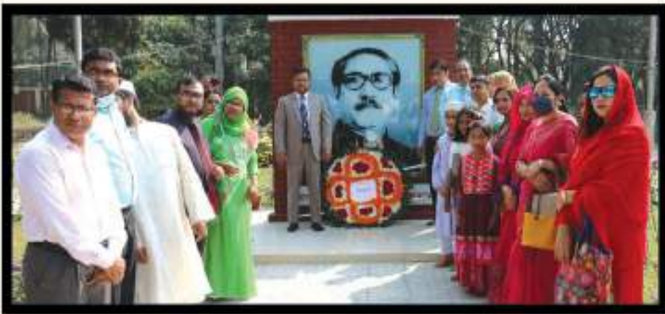
জাতীয় শিশু দিবসে বঙ্গবন্ধুর অস্থায়ী ম্যুরালে পুষ্পস্তবক অর্পণ।