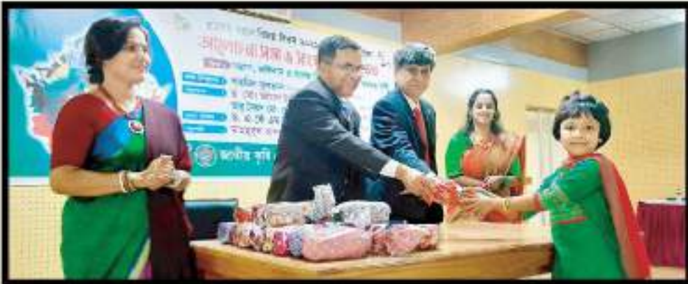
১৬ ডিসেম্বর বিজয় দিবস উপলক্ষ্যে পুরস্কার বিতরণ অনুষ্ঠান