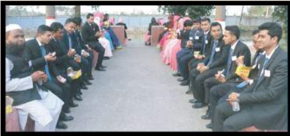
DG's Tea অর্থাৎ মহাপরিচালক মহোদয়ের চা" চক্রের মুহূর্ত।