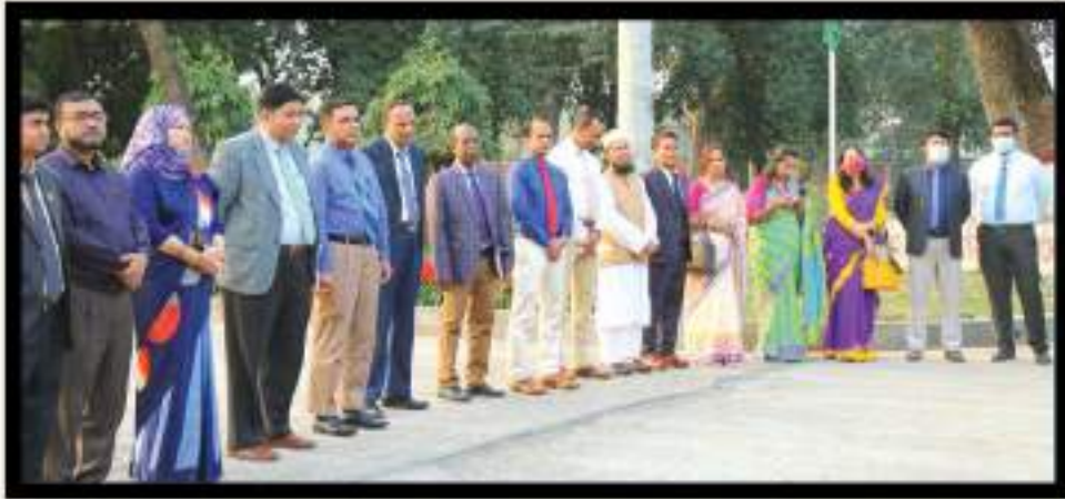
DG's Tea অনুষ্ঠানে নাটার মহাপরিচালক মহোদয়ের সাথে অনুষ্ঠান সদস্যবৃন্দ।