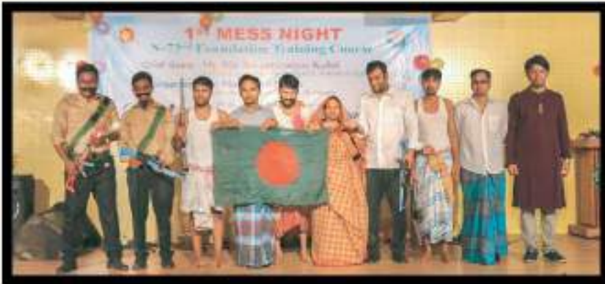
১ম মেসনাইটে মুক্তিযুদ্ধ বিষয়ক নাটিকায় অংশগ্রহণকারী প্রশিক্ষণার্থীবৃন্দ।