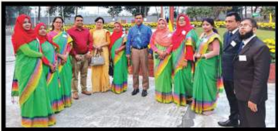
DG's Tea অনুষ্ঠানে নাটার মহাপরিচালক মহোদয়ের সাথে প্রশিক্ষণার্থীবৃন্দ।