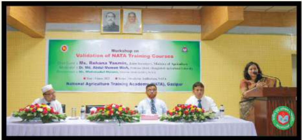
ভ্যালিডেশন ওয়ার্কশপে বক্তব্য রাখছেন যুগ্মসচিব (প্রশাসন), কৃষি মন্ত্রণালয় মহোদয়