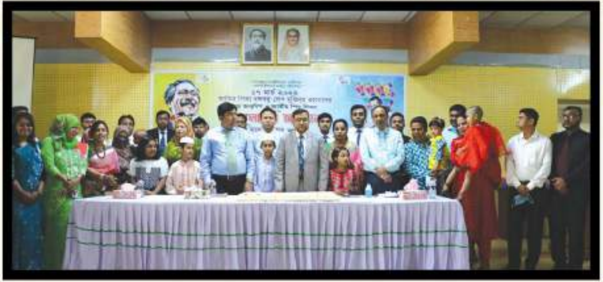
জাতির পিতা বঙ্গবন্ধু শেখ মুজিবুর রহমান এর জন্মদিন ও জাতীয় শিশু দিবসে শিশুদের নিয়ে কেক কাটছেন নাটার মহাপরিচালক মহোদয়।