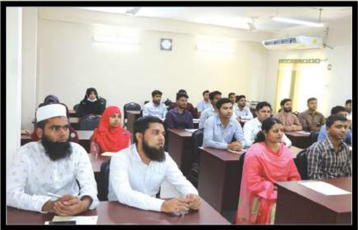
জাতীয় কৃষি প্রশিক্ষণ একাডেমির ৩য় ও ৪র্থ শ্রেণির ২০ ক্যাটাগরির ৩৬টি শূন্য পদে নবনিয়োগ প্রাপ্ত কর্মচারীগণ।