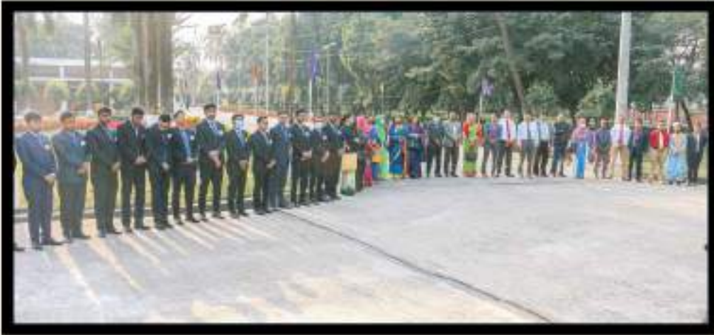
DG's Tea অনুষ্ঠানে নাটার মহাপরিচালক মহোদয়ের সাথে অনুযদ সদস্য ও প্রশিক্ষণার্থীবৃন্দ।