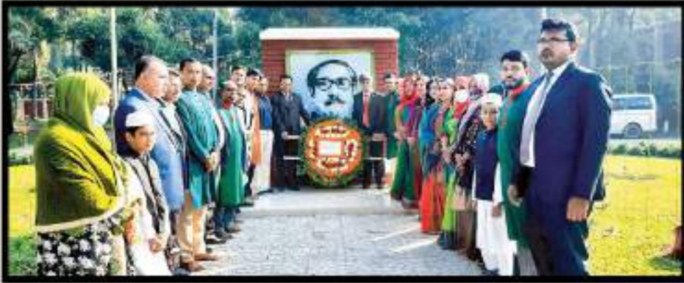
১৬ই ডিসেম্বরে বঙ্গবন্ধুর ম্যুরালে পুষ্পস্তবক অর্পণ