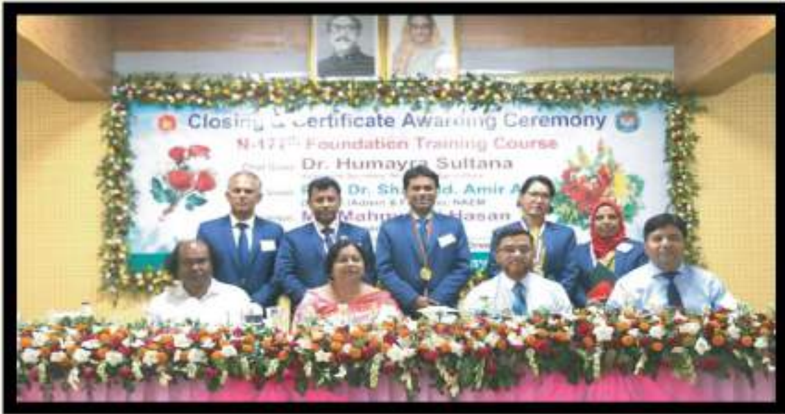
সরকারী কলেজ শিক্ষকদের এন-১৭৭তম বুনিয়াদি প্রশিক্ষণের মেধাক্রমে থাকা প্রশিক্ষণার্থীদের সাথে আমন্ত্রিত অতিথিবৃন্দ।