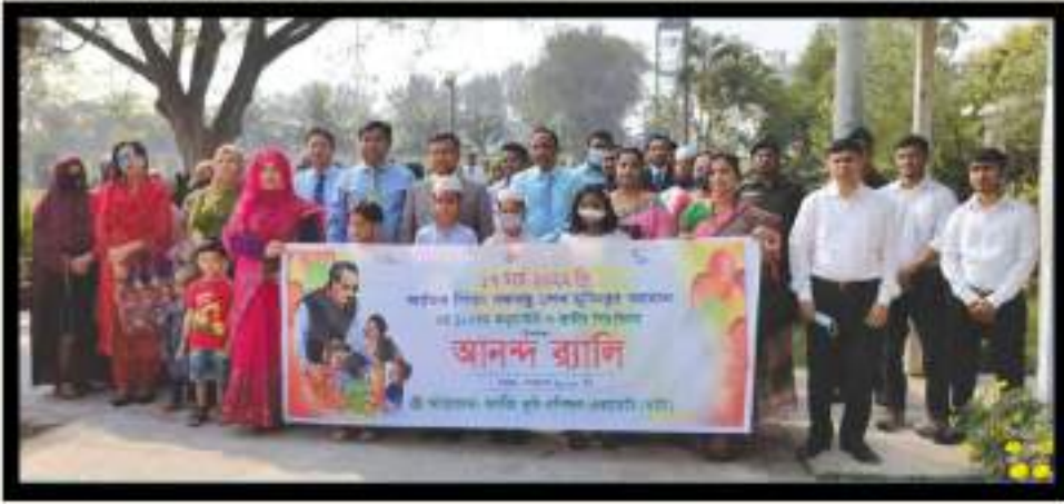
জাতির পিতা বঙ্গবন্ধু শেখ মুজিবুর রহমানের জন্মদিন ও জাতীয় শিশু দিবসে আনন্দ র্যালি।