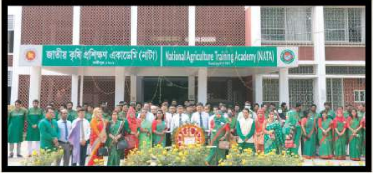
মহান স্বাধীনতার সুবর্ণ জয়ন্তী উপলক্ষে নাটার অনুযদ সদস্যবর্গ ও প্রশিক্ষণার্থীবৃন্দ কর্তৃক পুষ্পস্তবক অর্পণ।